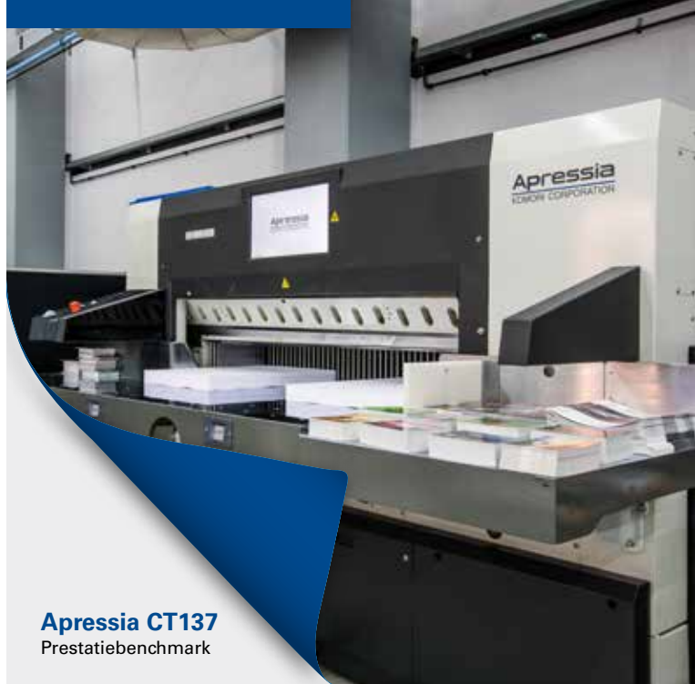
Apressia CT137 Prestatiebenchmark

Snijden, stansen en lamineren zijn afwerkingsoplossingen, die het offset- en digitale product-assortiment perfect complementeren. Wij laten u kennismaken met oplossingen die niet alleen knelpunten in het post-drukpersproces elimineren door de insteltijd dramatisch te verminderen en taken sneller uit te voeren, maar ook verbeterde ontwerp-opties leveren met de productie van ingewikkelde cut-outs, etsen en stansen met variabele data. Het potentieel van deze combinatie is ideaal voor drukkerijen die een breed scala aan innovatieve toepassingen willen aanbieden.