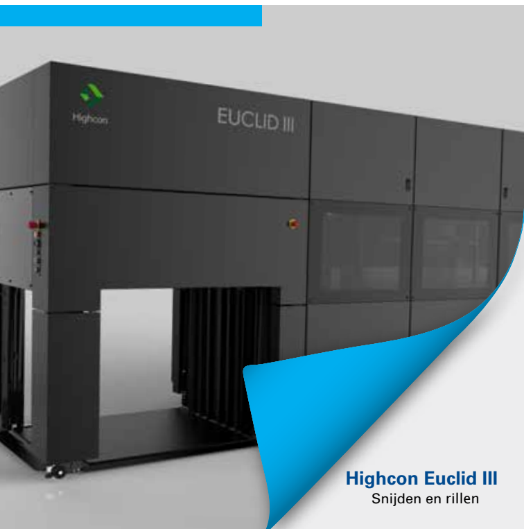
Highcon Euclid III Snijden en rillen